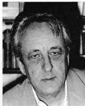
Louis Althusser în 1976

S-a născut în Algeria, unde a locuit până în 1930. A fost închis cinci ani într-un lagăr de concentrare nazist. A studiat la Paris și a ajuns să predea la Collège de France. În 1965, a organizat un seminar care avea să schimbe interpretarea operei lui Marx („Lire le Capital “) și a publicat Revoluția teoretică a lui Marx , devenind unul dintre cei mai studiați marxști ai lumii. Pe parcursul vieții, a urmat tratament psihiatric pentru depresie. În 1980, în timpul unei crize maniacale, și-a strangulat soția. În ultimii săi ani de viață, și-a scris autobiografia, intitulată L'avenir dure longtemps .