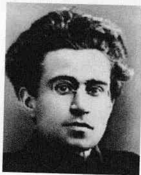
Antonio Gramsci în 1916

A avut o copilărie marcată de sărăcie și infirmitate. S-a alăturat Partidului Socialist Italian și, împreună cu Togliatti, a fondat revista L'Ordine nuovo 1 , în 1919. Desfășurarea Revoluției ruse l-a determinat să fondeze Partidul Comunist Italian, al cărui reprezentant la Moscova a devenit. Ajungerea la putere a lui Mussolini l-a obligat la o viață în exil și clandestinitate. S-a întors în 1924, ca deputat, protejat de imunitatea parlamentară, însă dictatura fascistă l-a destituit în 1926. Și-a petrecut restul zilelor la închisoare, în condiții cumplite, bolnav de tuberculoză. Aici și-a scris faimoasele Scrisori din închisoare , cea mai importantă operă a sa. A decedat pentru că nu a fost transportat la spital, ca să primească acolo îngrijirile necesare.